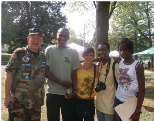
Със студенти от Африка и Бахамите

След като установиха, че съм с оценки по критериите на колежа, може да се каже, че бях приета.