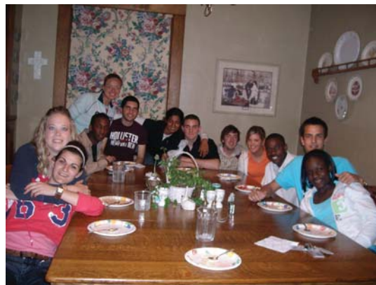
С приятели от Бразилиа, Бахамите, Ирландия, Испания, Германия, САЩ и Индия

Всичко до голяма степен се контролира от графика ми покрай футбола. Денят ми започва към осем часа като училищните ми задължения са до към 14 часа. Имам около час почивка и отивам на тренировка. След тренировка вечеряме и остава времето за писане на домашни и време за приятели. Понякога имаме мачове, за които пътуваме по 4-5 часа което означава, че отива целият ден в път. Два пъти на месец ми се налага да отделим повече време за да слобя