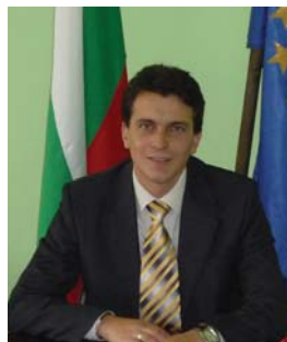
Уважаеми жители на община Елин Пелин,