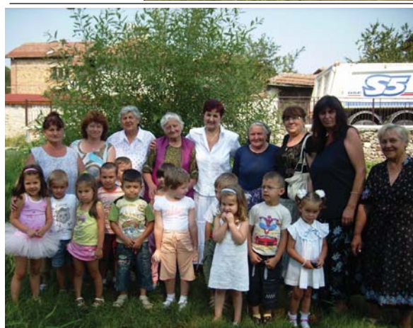
На 30.07.2009 г. децата от целодневна детска градина „Радост“ гр. Елин Пелин гостуваха на Дневен център за възрастни хора в пенсионна възраст в Община

Лицата, чиито молби са обработени и имат издадени заповеди също няма да получат обявената помощ от 276,15 лв.Към настоящия момент Дирекция “Социално подпомагане” няма информация за начина на ирплащане на целевите помощи за отопление за отоплителен сезон 2009-2010 година.