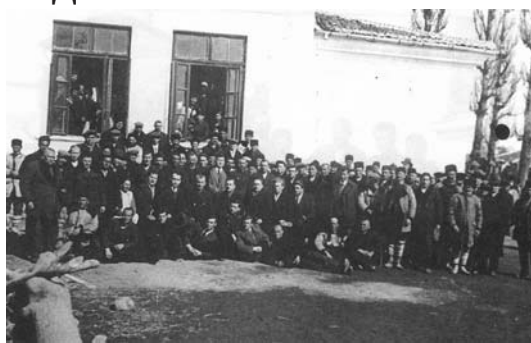
Учредителите на РПК „Развитие“ - 1920 г.

Първите стъпки на кооперацията са трудни, тъй като България е разорена от войните, стоките фондове са малки, а политическите събития още разклащат икономическия живот на страната. Кооперацията е принудена да работи в условията на остри политически борби. Военно – фашисткия преврат от 9 юни 1933 година и последвалото го Септемврийско въстание се отразяват крайно неблагоприятно върху дейността на