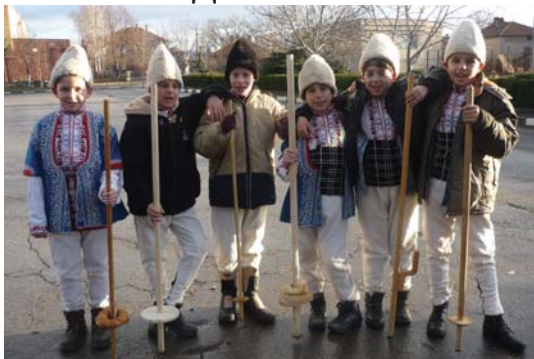
Коледари в с. Мусачево

Коледуване и „Топене на пръстени“ в с. Мусачево