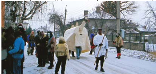
„Джамал“ в с. Равно поле

Стопаните посрещяха с радост коледарите и ги даряваха