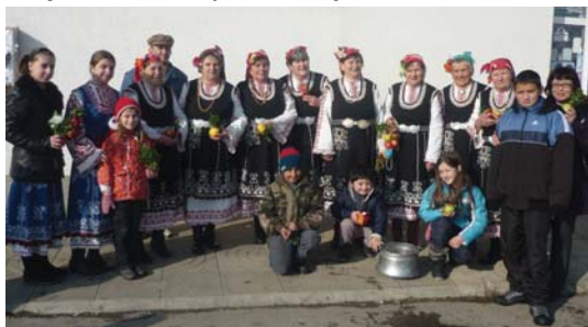
„Топене на пръстени“ в с. Мусачево

и водосвет на Йордановден в с. Равно поле