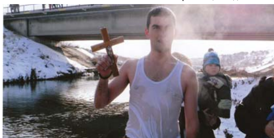
Йордановден в с. Равно поле

На 13 януари пред клуба на пенсионерите се събраха млади и стари, за да пуснат пръстенче или друго украшение в котлето. Ако през нощта водата в кот-