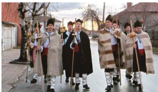
Коледари в с. Равно поле

от 120 лева за благородната кауза на Великолепната шесторка, учениците от ОУ „Христо Ботев“ и самодейците при читалище „Прометей 1922“ с. Равно поле, организираха Коледен благотворителен концерт, за да подпомогнат газифицирането на детската градина в с. Равно поле.